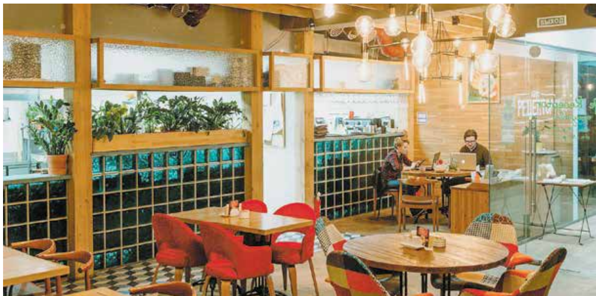
САЙТ РЕСТОРАНА «РЕЦЕПТОР»